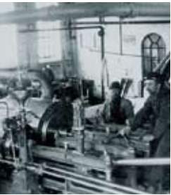
A/S FRICHS I ÅRHUS, MONTAGEVÆRKSTEDET CA. 1890

holdet i udlandet eksempelvis påbegyndes den 1. august 2007 og afsluttes den 1. maj 2008.