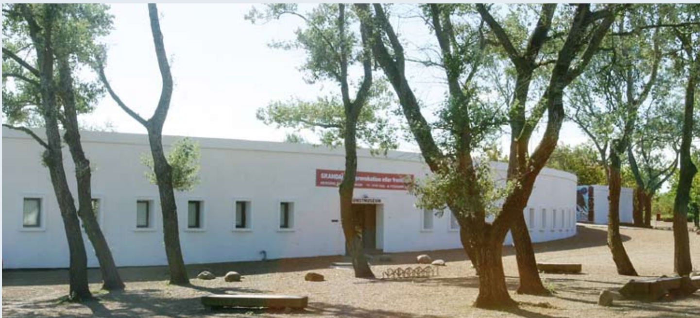
ANGLIFABRIKKEN I HERNING, BYGGET 1965. (I DAG: HERNING KUNSTMUSEUM)