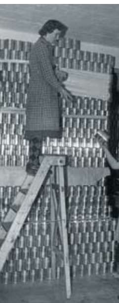
ODENSE KONSERVEFABRIK 1955