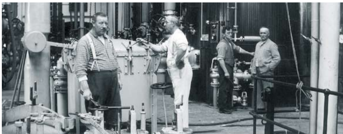
SUKKERKOGERIET I ODENSE, FABRIKSHAL CA. 1930