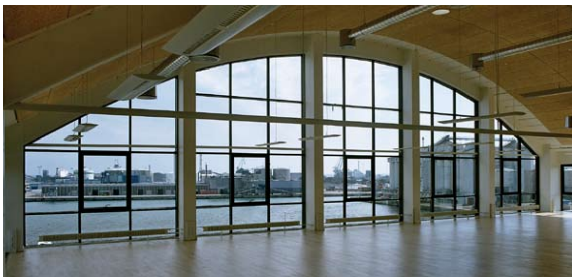
© Martin Tørsløff og Erik Balle Povlsen

Hvis likvidationsprovenuet udloddes i kalenderåret forud for foreningens endelige opløsning, beskattes hele udlodningen som kapitalindkomst. Det betyder, at andelshaveren ikke får fradrag for andelsbevisets anskaffelsessum, men andelshaveren har dog mulighed for at ansøge om dispensation i denne situation.