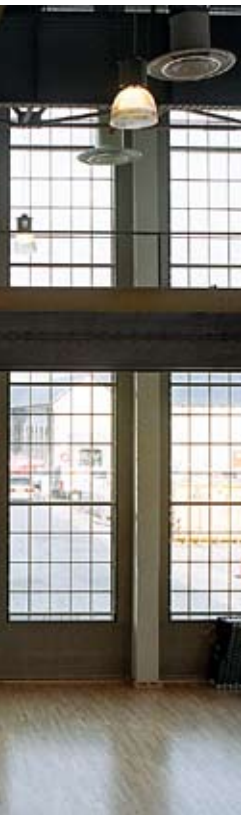
DGI-HUSET I ÅRHUS

Den stigende internationalisering er en af årsagerne til, at mange danskere tager udfordringen op og arbejder i udlandet i en periode.