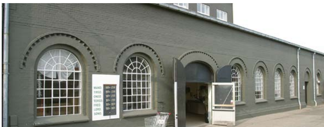
SUKKERKOGERIET I ODENSE, BYGGET 1872 (I DAG: FØRSKELLIGE FORMÅL)