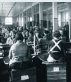
KROGHS TOBAKSFABRIK, VIBORG 1925