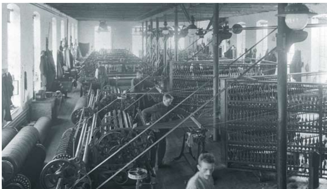
BRANDTS KLÆDEFABRIK, KÆDESKÆRIET 1919