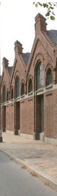
KVÆGTORVET I ODENSE

Det er dog værd at huske på, at den nye praksis kun omfatter den enkelte bygning, hvor der støbes en individuel sokkel. Hvis et byggeprojekt f.eks. omfatter flere boligblokke på samme grund, men på individuelle sokler, skal der holdes styr på, hvornår der sælges lejligheder i den enkelte boligblok i forhold til det tidspunkt, hvor støbningen af blokkens egen sokkel blev indledt.