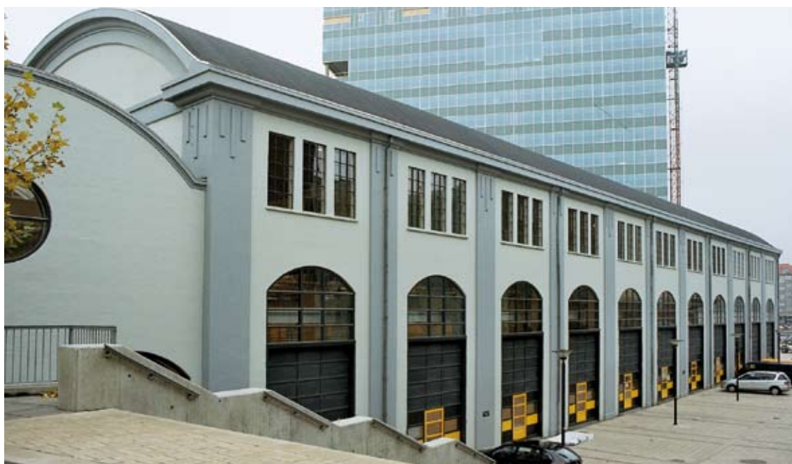
DSB'S CENTRALVÆRKSTED I ÅRHUS (I DAG: DGI-HUSET)

I Danmarks dobbeltbeskatningsoverenskomster med andre lande sker lempelse for lønindkomst som regel efter kreditmetoden. Eksemptionmetoden anvendes eksempelvis i overenskomsterne med Frankrig og Østrig. Ved arbejde i Tyskland eller et af de nordiske lande afhænger lempelsesmetoden af, i hvilket land personen er omfattet af social sikring. Lempelse sker efter kreditmetoden, hvis personen er omfattet af dansk social sikring, medens lempelse sker efter eksemptionmetoden med progressionsforbehold, hvis personen er omfattet af social sikring i arbejdslandet.